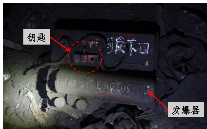
图 6 发爆器及钥匙

3. 班前会安排+93 米北一运输平巷 1#采煤工作面进行采煤作业。在+93 米北一运输平巷 1#采煤眼口发现发爆器和钥匙(见图 6)，1#采煤工作面堆积有爆破落下的煤炭。