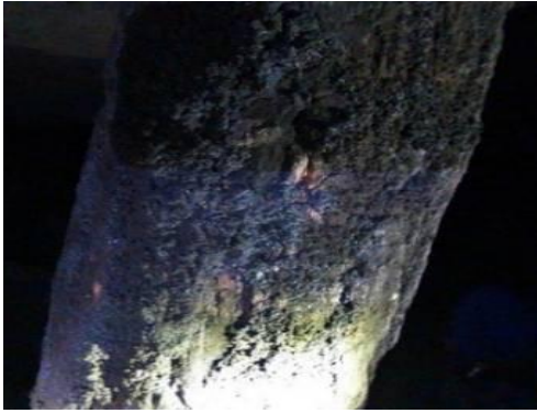
图 3 木点柱上的煤尘结焦