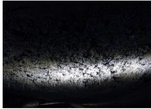
图 4 顶板上的煤尘结焦

4. 排除煤尘为唯一爆炸物。事故发生前，+93 米北一运输平巷 1 # 采煤工作面作业主要是堆矸石垛、钻孔、装药、爆破。钻孔和爆破可能产生煤尘、释放出瓦斯，爆破还可以产生火焰，具备火源、瓦斯、煤尘条件。但要在爆破产生火焰的延续时间内，因爆破扬起的煤尘达到爆炸浓度的可能性比较小，更大可能是爆破前瓦斯和煤尘浓度均比较高，空气中瓦斯的的存在会降低煤尘的爆炸浓度下限，煤尘的存在也会降低瓦斯的爆炸浓度下限，爆破火焰使瓦斯爆炸并扬起更多的煤尘参与爆炸。因此，排除煤尘为唯一爆炸物的可能。