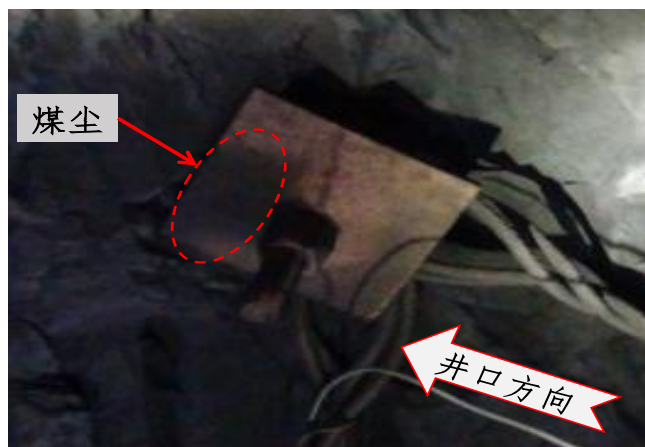
图 5 北一运输平巷 1#采煤眼至+93 米下部车场段的巷道顶板锚杆

翼运输平巷采掘工作面风筒全部被烧焦，其他区域风筒烧焦程度逐渐减弱。说明爆炸产生的高温火焰中心区域在+93 米北一运输平巷 1#采煤眼附近巷道。